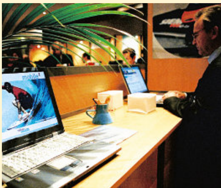
Cyber café Siemens 2003